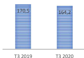
Evolution du CA cumulé en MMAD